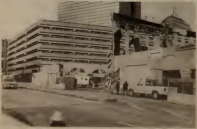
Dartmouth St. view of New Back Bay Station with Hancock Garage and buildings in the background.

White Contracting Company), Landscaping, West Canton/Harcourt Street to Mass. Ave. , is underway. The contractor began work on drainage and retaining walls on the St. Botolph edge during the winter. Major landscaping construction and planting will begin in the Spring.